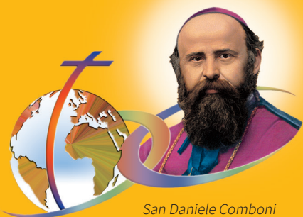
San Daniele Comboni